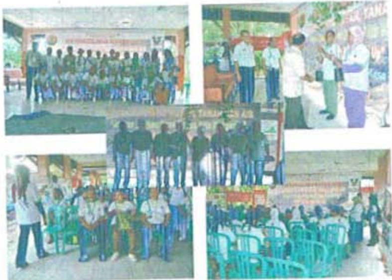
GAMBAR : PERINGATAN HARI PENANGGULANGAN DEGRADASI LAHAN MKTI - GURU-MURID-PRAKTIISI DAN PEMERHATI LINGKUNGAN